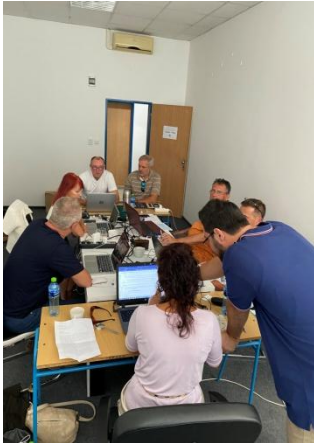
Photo from the working session of the energy community organizers Photo from the founding meeting of the energy community Foto z pracovného zasadnutia organizátorov energetickej komunity Foto zo zakladajúceho rokovania energetickej komunity